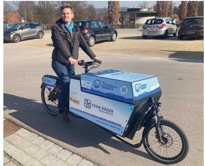
Das Lastenrad „Yannik“ am Parkplatz Irlbach Kirche