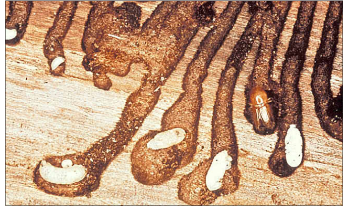
Larven und Jungkäfer des Buchdruckers.

Es bleibt fest zu halten: Wir werden im April / Mai 2016 mit einem wesentlich höheren Ausgangsbestand als 2015 in die neue Borkenkäfersaison gehen!