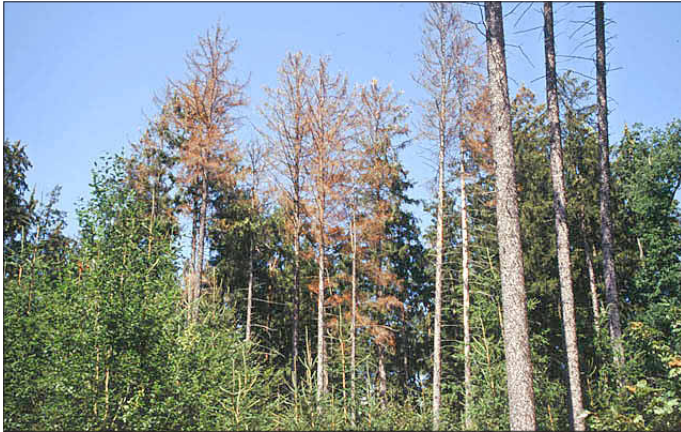
Abgestorbene Fichten infolge eines Borkenkäferbefalls.