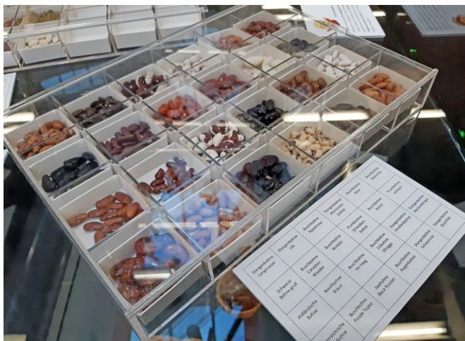
Gartenbegeisterte gesucht, um wertvolle Bohnensorten zu erhalten!

Regensburg (RL). Weil Vielfalt vom Mitmachen lebt, suchen die Mitarbeiterinnen und Mitarbeiter der Abteilung Gartenkultur und Landespflege am Landratsamt 50 Gartenbesitzerinnen und -besitzer, die beim Erhalt alter Bohnensorten helfen wollen.