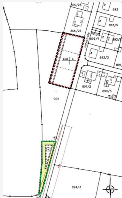
Auszug Planentwurf Einziehungssatzung ohne Maßstab BEARBEITUNG GEMEINDE WENZENBACH