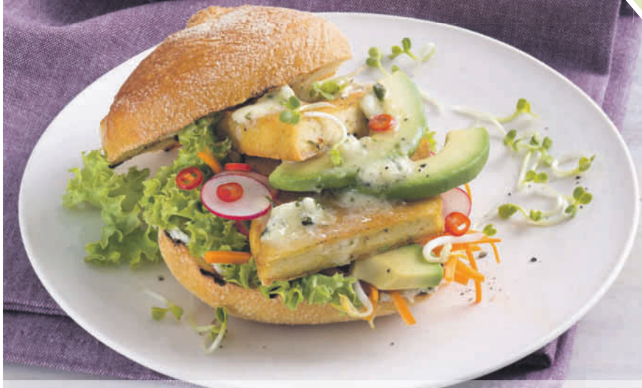
Mit frischen Zutaten lässt sich der Burger zuhause vielfältig zubereiten. Wie wäre es zum Beispiel mit einem Veggie-Tofuburger?