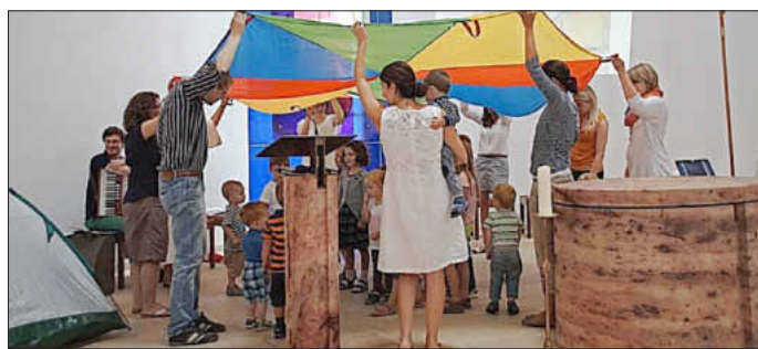
Die Kinder sollen es spüren: Gottes Segen ist wie ein großes Zelt