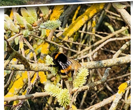
Hummel an Weidenkätzchen bei Grünthal