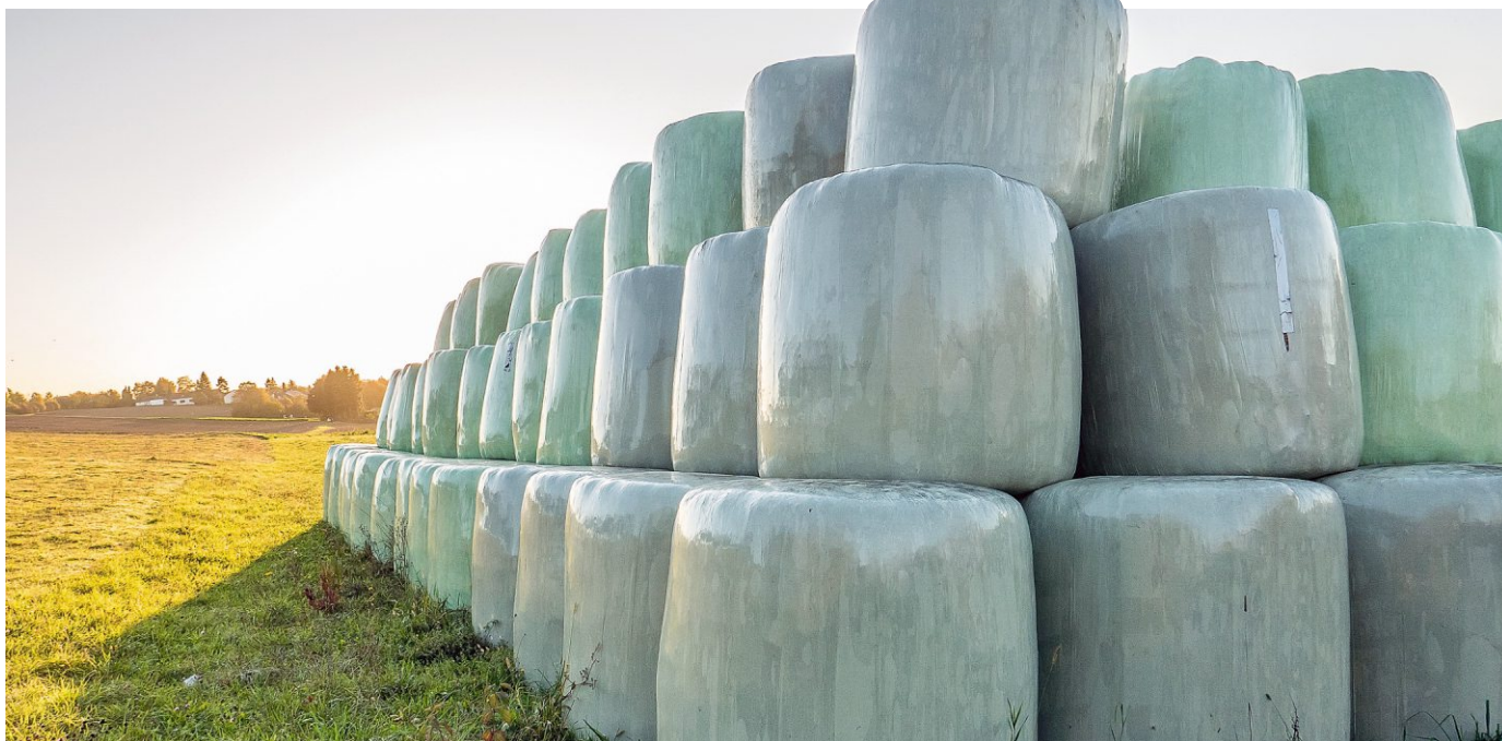
Auch in diesem Jahr können verwertbare Folien, die in der Landwirtschaft angefallen sind, abgegeben werden.

LANDWIRTE KÖNNEN SICH BIS ZUM 5. JUNI 2020 AUCH ONLINE ANMELDEN