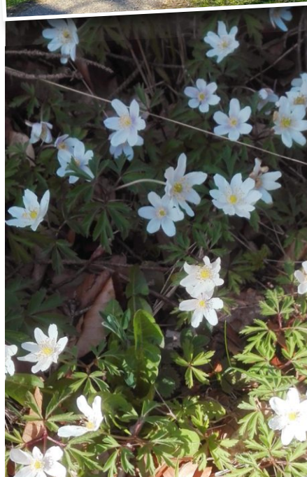
Anemonen, auch Buschwindröschen genannt am Radweg Richtung Bernhardswald