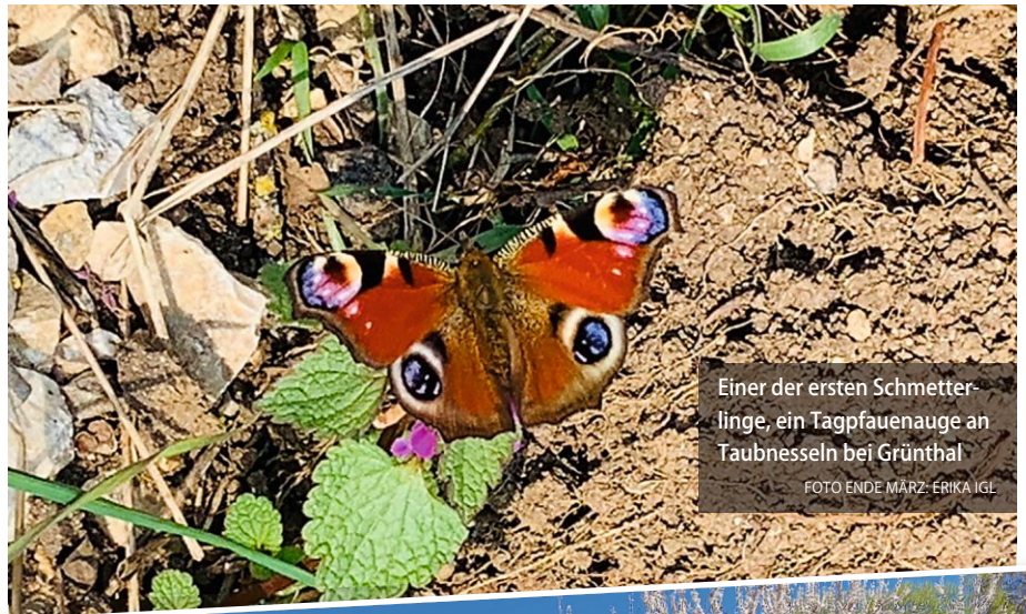
Einer der ersten Schmetterlinge, ein Tagpfauenauge an Taubnesseln bei Grünthal