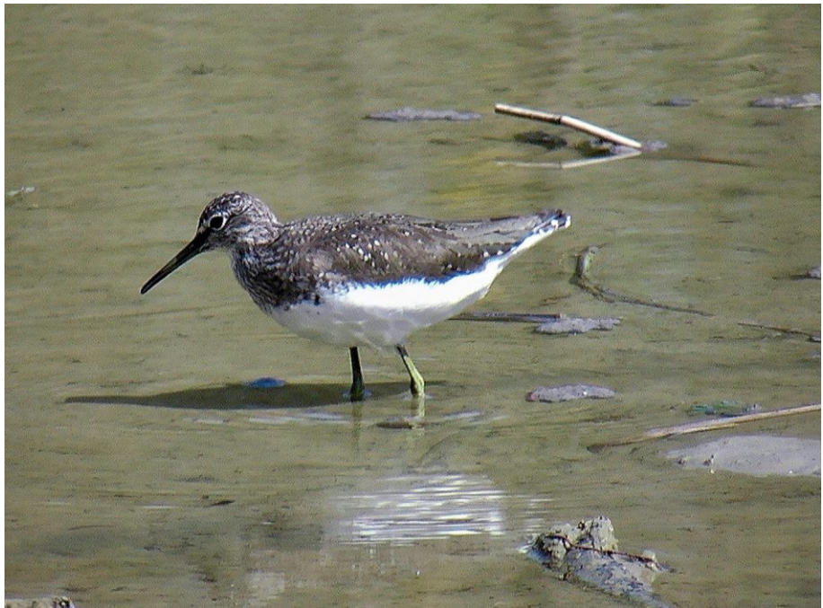
Die Wiesenbrüter gehören zu den außerordentlich selten gewordenen Vogelarten

Normalerweise stellen die Krähen oder andere Fressfeinde keine Gefahr für die Vögel dar. Werden die Altvögel aber durch Hunde oder querfeldein gehende Menschen vom Nest verschreckt, können Rabenvögel die Nester plündern. Bei lang anhaltenden Störungen kühlen die Eier aus und die Brut muss aufgegeben werden. Jede Störung bedeutet zusätzlichen Stress während der ohnehin anstrengenden Brut- und Aufzuchtphase. Die gefährdeten Wiesenbrüter und auch der Weißstorch, der in der Aue seine Nahrung sucht, genießen besonderen und strengen Schutz nach dem Naturschutzgesetz. In den oben genannten Gebieten müssen Hunde angeleint werden und die Wege dürfen nicht verlassen werden – auch nicht von angeleinten Hunden.