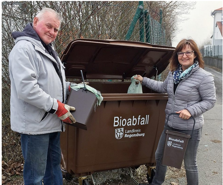
Die Bioabfallsammlung im Landkreis Regensburg wird sehr gut angenommen.

Derzeit bringen die Bürgerinnen und Bürger des Landkreises durchschnittlich 100 Tonnen Bioabfälle monatlich auf und vor die Wertstoffhöfe. Im Jahr 2019 waren es insgesamt rund 1220 Tonnen, während 1100 Tonnen im Jahr 2018 und 700 Tonnen im Jahr 2017 gesammelt wurden. Wesentlich beigetragen zur hohen Akzeptanz in der Bevölkerung hat die ab Mai 2017 in acht Gemeinden zugängliche Bioabfallsammlung in Containern vor den Wertstoffhöfen und somit die Möglichkeit der Abgabe außerhalb der Öffnungszeiten der Wertstoffhöfe. Aufgrund des positiven Resonanz wurde die Aufstellung der Bioabfallcontainer im Außenbereich der Wertstoffhöfe auf nahezu alle Gemeinden ausgeweitet.