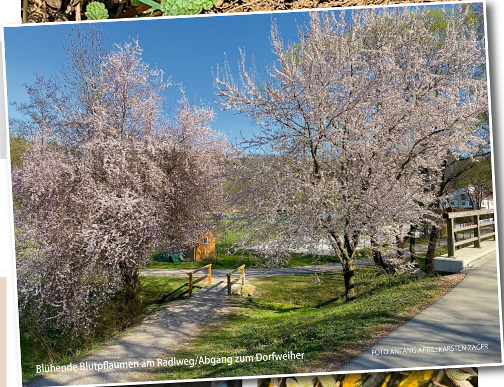
Blühende Blutpflaumen am Radweg/Abgang zum Dorfweiher

Was ist ein Tinyhouse? Info dazu: www.tinyhouse-prommersberger.de