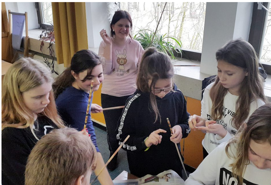
Kopfhare unter der Klinge des Steinzeitmessers zu Boden.

Wie scharf zeigte sich an einer kleinen Demonstration. Hierfür hielt im wahrsten Sinn des Wortes ein Schüler seinen Kopf hin und mit einem schnellen Zug fiel ein Bündel seiner