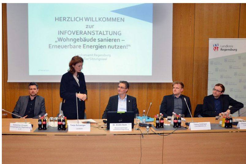
Auf großes Besucherinteresse stieß der Informationsabend des Landkreises Regensburg zu den ausgeweiteten Fördermöglichkeiten bei der energetischen Gebäudesanierung

http://www.energieagentur-regensburg.de/downloads/foerderkompass-energie/