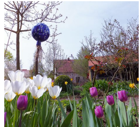
Frühlingserwachen im Garten

zwei Wochen über das ganze Jahr verlängert. Für uns Gärtner ist das erstmal kein Problem. Wir können auch mit dem „Garteln“ früher anfangen. Sobald der Boden oberflächlich abgetrocknet und ausreichend warm ist, kann mit der Bestellung im Gemüsegarten begonnen werden. Wenn Sie jetzt fragen: „Wann ist denn der Boden ausreichend warm?“, dann lautet die Antwort: „Wenn Sie mit der Hand in den Boden greifen und die Finger nicht mehr frieren!“ Jetzt können Sie auch erstmals wieder den Kompost umsetzen, um den Rottevorgang zu fördern. Hilfreich dafür ist die Verwendung mehrerer Kompostboxen nebeneinander. So können Sie das Material aus einem Behälter in den benachbarten leeren Kompostbehälter füllen. Dadurch erreichen Sie gleichzeitig die optimale Vermischung. Oft finden sich beim Umsetzen weiße dicke Käferlarven im Kompost. Das sind in der Regel Rosenkäferlarven. Die sollten Sie unbedingt am Leben lassen, denn sie tragen zur Zersetzung des Komposts bei. Wenn Sie bereits weitestgehend zersetzten Kompost haben, den Sie absieben können, dann ist das die ideale Startdüngung, sowohl für die Gartenbeete als auch für den Rasen. Im Gemüsegarten sollten Sie dabei maximal die Menge von zwei Litern auf den Quadratmeter ausbringen. Für den Rasen können es bis zu fünf Liter sein. Bei Blumenbeeten ist eher