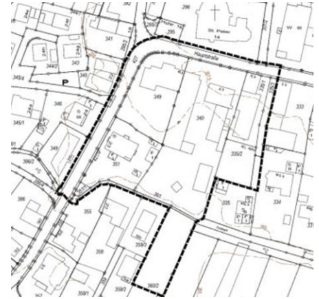
Auszug aus Kommunalem geographischen Informationssystem, verkleinert Darstellung ohne Maßstab, Bearbeitung Gemeinde Wenzelbach

Im Osten durch die Grundstücke mit den Flurnummern 361; 367/3; 391; 355; 334; 333, jeweils der Gemarkung Wenzelbach und auf einer Länge von ca. 8 m über die Hauptstraße gemessen vom zwei-