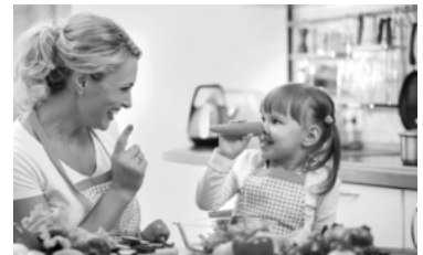
Gesunde Ernährung und Spaß an der Bewegung sind entscheidend für die geistige und körperliche Entwicklung von Kindern und Jugendlichen.

Zentrales Element in den Ämtern ist der Sinnesparcours für Kinder, in dem 5- bis 10-Jährige spielerisch ihre Sinne trainieren: An Entdecker-Stationen können sie Lebensmittel sehen, fühlen, hören, riechen und schmecken. Den Abschluss der Ernährungstage bildet am 27. Juni der große Kindertag der Ernährung im Schmuckhof des StMELF in München (Ludwigstr. 2, Odeonsplatz). Während der Nachwuchs in der Kinder-Uni erfährt, warum der Körper Nährstoffe braucht, finden Eltern beispielsweise Informationen zur Verpflegung an Schulen und Kitas. Und die ganze Familie kann sich auf Mitmachaktionen, Kochevents und ein buntes Rahmenprogramm mit Musik, Bewegungsspielen und Theater freuen.