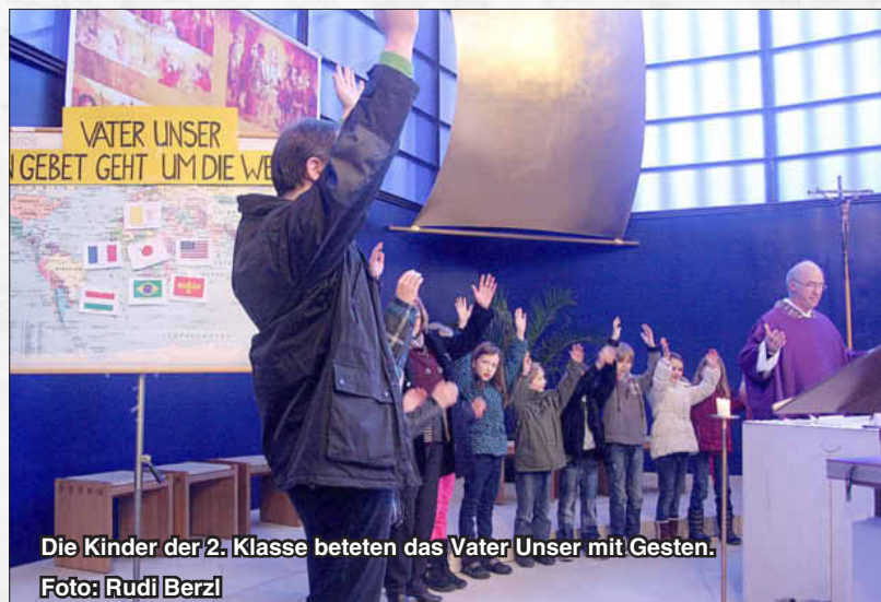
Die Kinder der 2. Klasse beteten das Vater Unser mit Gesten.