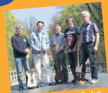
Seniorenrockband "Bones Trader"