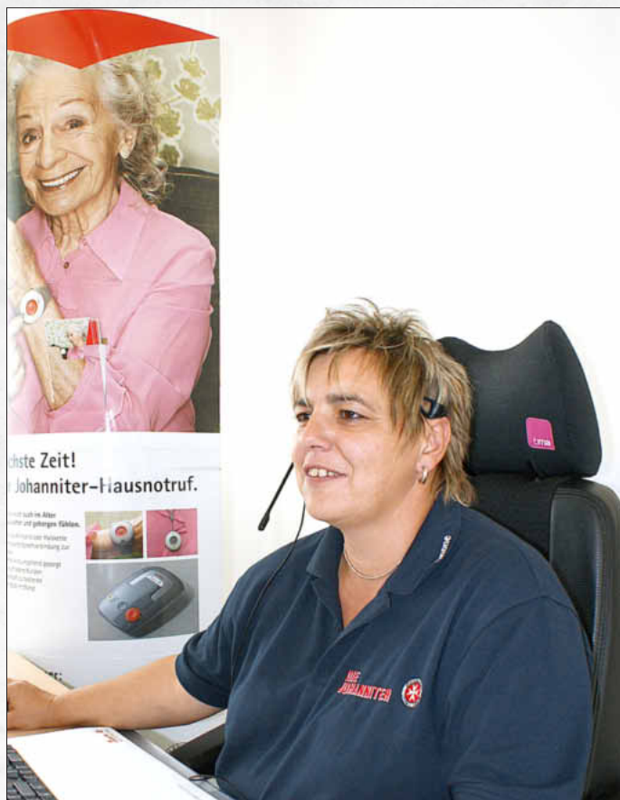
Die Mitarbeiter der Hausnotruf-Zentrale Bayern bearbeiten an 365 Tagen im Jahr rund um Uhr die Notrufe der 11.036 Johanniter-Hausnotruf-Kunden in Bayern.

Die Hausnotruf-Zentrale der Johanniter in Bayern befindet sich in der Regionalgeschäftsstelle Ostbayern mit Sitz in Regensburg. Dort gehen an 365 Tagen im Jahr rund um die Uhr Notrufe der mittlerweile 11.036 Hausnotruf-Kunden in Bayern ein. In Stadt und Landkreis Regensburg vertrauen aktuell 667 Kunden dem Johanniter-Hausnotruf.