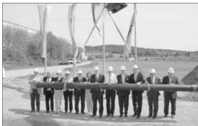
Die Ehrengäste vor dem Einbau des letzten Abwasserrohres