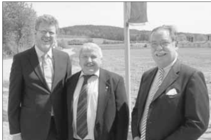
Staatsminister Marcel Huber, Zweckverbandsvorsitzender Fritz Dechant und der zuständige Stimmkreisabgeordnete Philipp Graf von und zu Lerchenfeld

Neben dem Gründungsdatum 11.11.1964 wird der 30.04.2012 als weiteres besonderes Datum in die Geschichte des Zweckverbandes zur Abwasserbeseitigung im Regental eingehen.