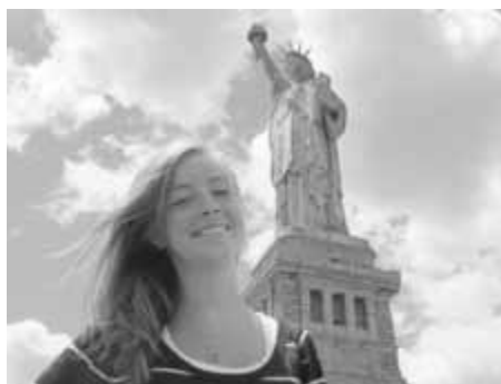
Treff - International Education e.V.

Ein Schuljahr in den USA , in Kanada , Australien oder Neuseeland zu verbringen, ist für viele junge Leute ein Traum. Im Ausland zur Schule gehen, Land und Leute