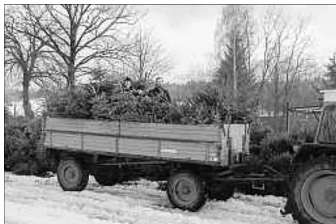
Christbäume, so weit das Auge reicht.