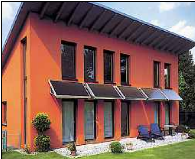
Holen Sie sich die Sonne vom Dach ins Haus. Mit der Solartechnik wird dies Realität.