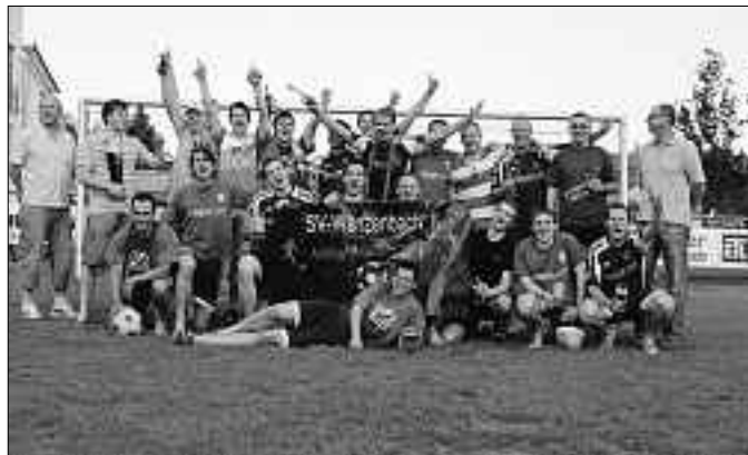
Die erfolgreiche Mannschaft mit ihren Betreuern