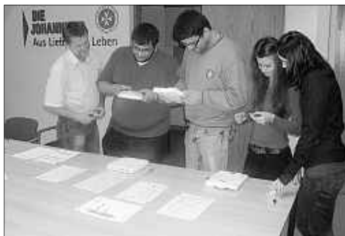
Hausnotrufgeräte werden den Ehrenamtlichen dargestellt und ihre Funktion erklärt