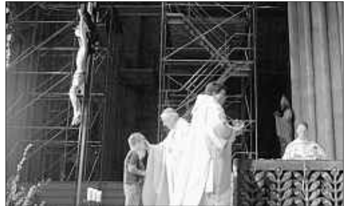
Firmlinge bringen im Dom die Gaben zum Altar

Die Wenzenbacher Firmlinge besuchten in der Karwoche den Jugendtag U14 in Regensburg. Zur Eröffnung im Kolpinghaus gab es mitreißende Musik zu hören. Danach konnten die Jugendlichen in verschiedenen Workshops Mosaik basteln, sich durch den Domschatz führen lassen oder Spaß mit Spielen in der Turnhalle haben.