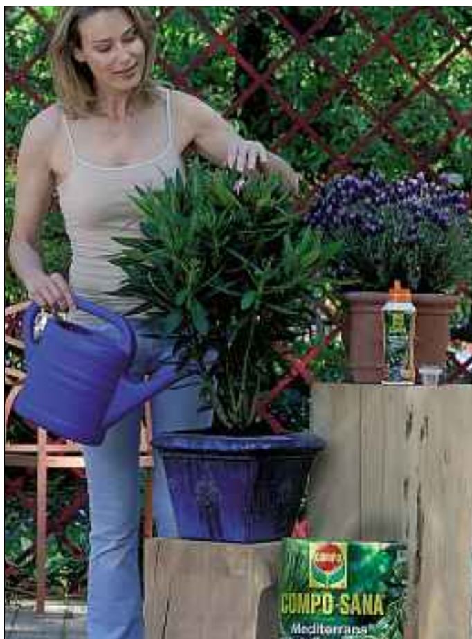
Stilvoll und dekorativ in Szene gesetzt: Podestplätze für mediterrane Pflanzenschönheiten.

Vier bis sechs Wochen lang stellt der in der Erde enthaltene Langzeitdünger mit allen wichtigen Haupt- und Spurennährstoffen das gedeihliche Wachstum sicher. Danach sollte Pflanzendünger mit einer speziellen Nährstoff-Formel für südliche Kübelpflanzen die bedarfsgerechte Versorgung von Lavendel, Rosmarin, Oleander & Co. übernehmen. Der hochwertige Flüssigdünger wird einfach nur dem Gießwasser beigemischt.