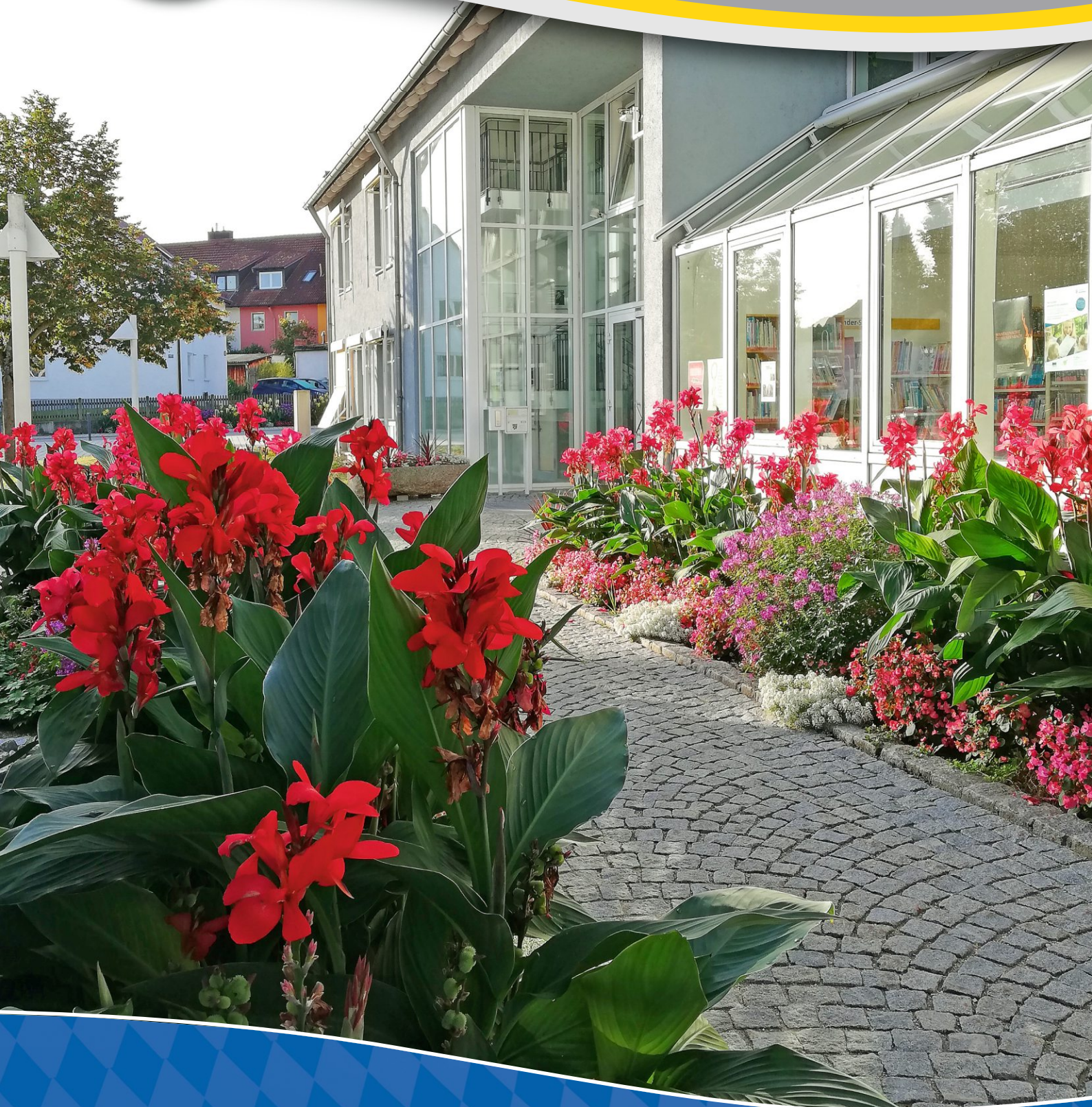
Blumenpracht vor dem Rathaus