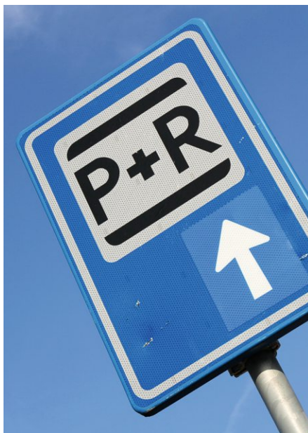
Rund 1,9 Millionen Euro fließen in naher Zukunft in den Ausbau der Park and Ride Anlagen (P+R) im Landkreis Regensburg

Bereits abgeschlossen ist der P+R - Ausbau in Eggmühl. Die Gemeinde Laaber hat bereits einen entsprechenden Förderantrag eingereicht; der Gemeinde Deuerling liegt schon eine Förderzusage vor. Für Obertraubling und Köfering ist ein Förderantrag in Vorbereitung. Weitere Ausbaupläne gibt es für Beratzhausen, Undorf und Etterzhausen. Erste Gespräche